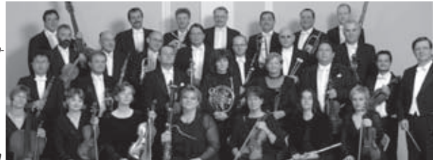
Die Mitteldeutsche Kammerphilharmonie,