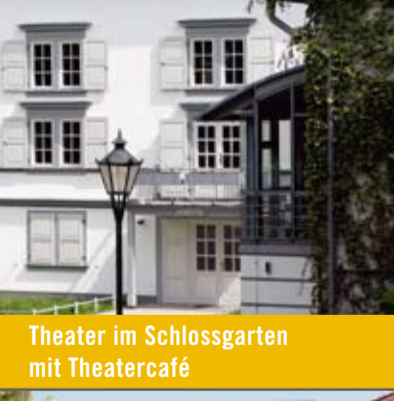
Theater im Schlossgarten mit Theatercafé