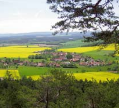
Wanderweg „Von Bach zu Goethe“