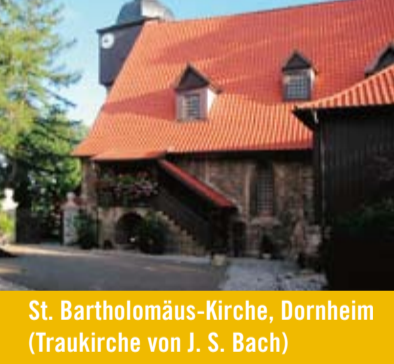
Wanderorgel der J.-S.-Bach-Kirche