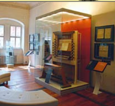
Ausstellung „Bach in Arnstadt“