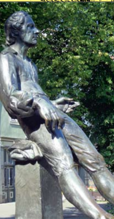
Bachdenkmal am Markt