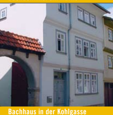
Bachhaus in der Kohlgasse