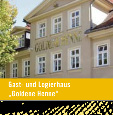
Gast- und Logierhaus „Goldene Henne“