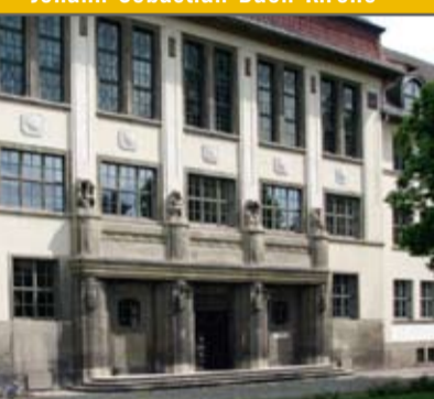
Schule am Schlossplatz